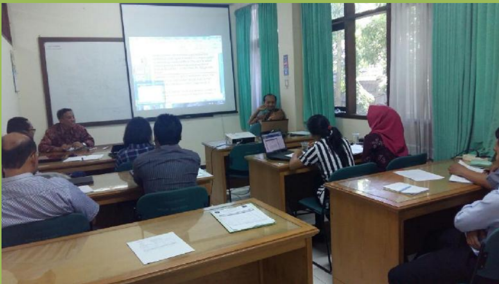
Pertemuan KPS dengan Dosen dan mahasiswa dalam rangka evaluasi PBM