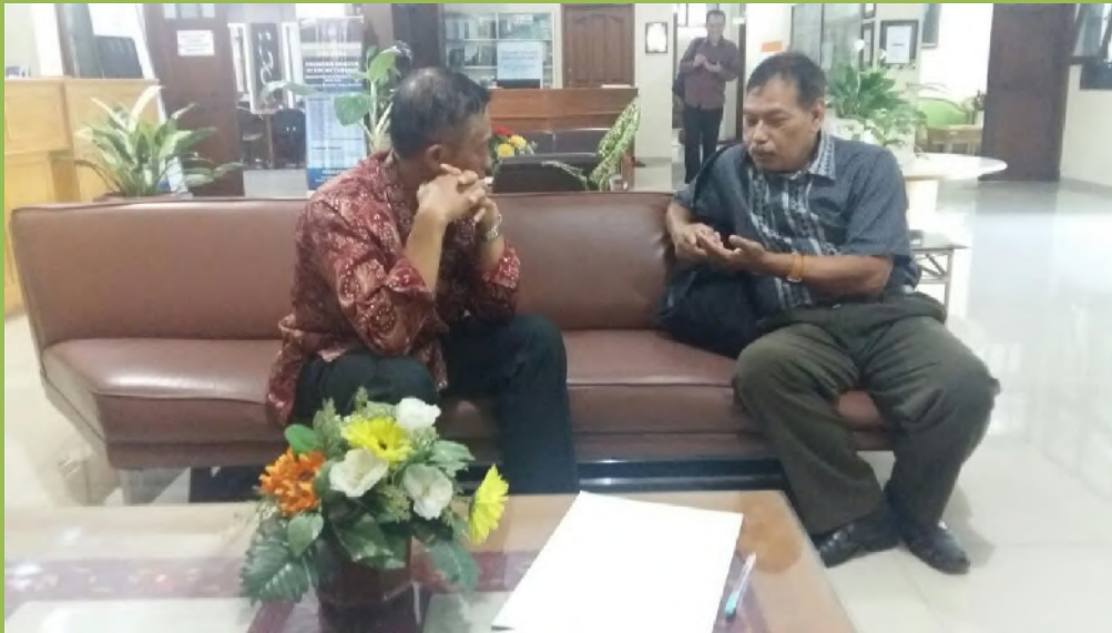
Pertemuan KPS dengan Dosen dan mahasiswa dalam rangka evaluasi PBM